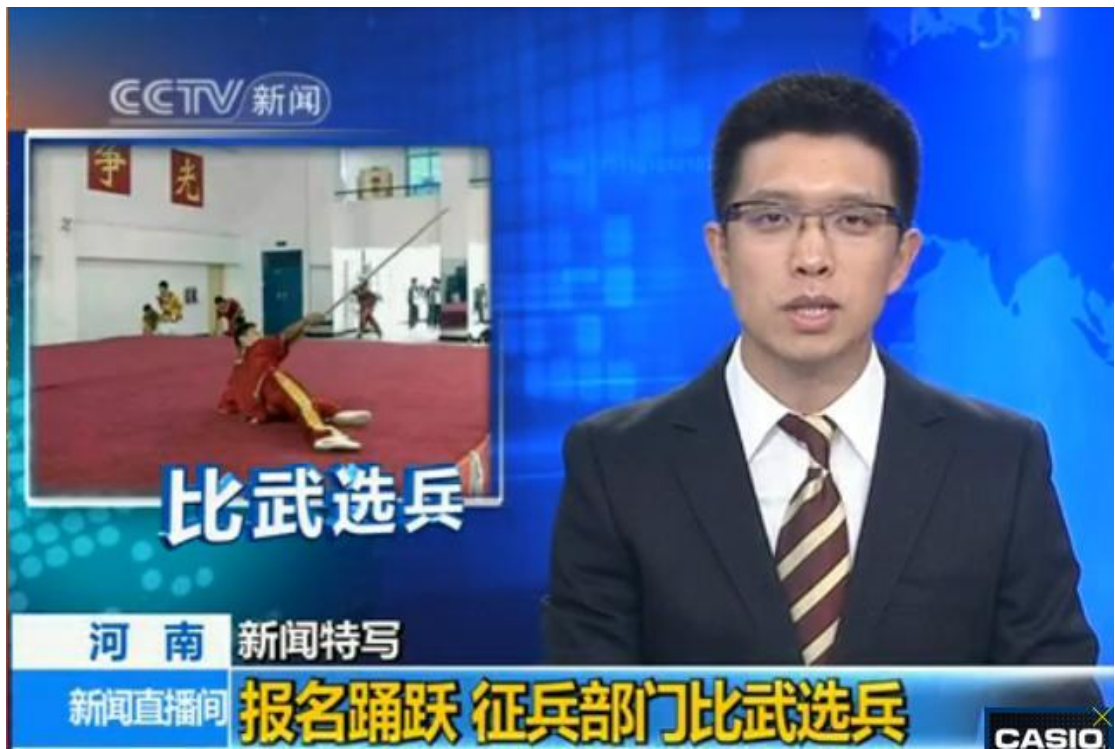
新闻联播报道我校“比武选兵”工作