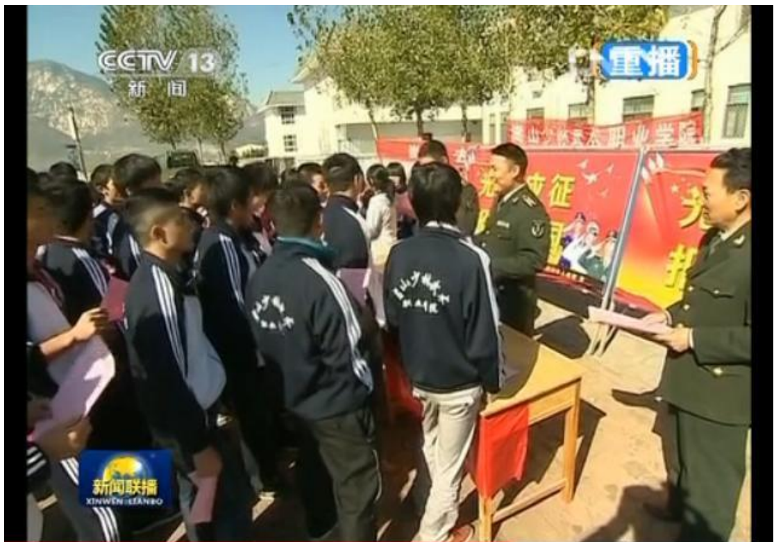
新闻联播报道我校“征兵报名”工作