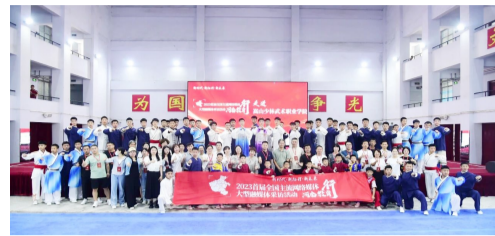
“2023首届全国主流网络媒体河南教育行”大型融媒体采访活动最后一站来到我院，来自人民网、新华网、央视网、中国网等全国40余家主流网络媒体的记者来到我院，通过观看视频、实地探访等方式，深入了解我院办学定位、办学特色、发展成果，感受武术教育的特色与魅力。活动以全媒体视角，全方位、多角度、立体化展示了学院发展新思路、新举措、新气象，是宣传学院发展的生动实践。

为全面贯彻落实党的二十大关于教育、科技、人才一体发展战略部署的引领力量，推动建设教育强省，宣传河南教育的各项创新成果，7月1日，“2023首届全国主流网络媒体河南教育行”大型融媒体采访活动最后一站来到我院，来自人民网、新华网、央视网、中国网等全国40余家主流网络媒体的记者来到我院，通过观看视频、实地探访等方式，深入了解我院办学定位、办学特色、发展成果，感受武术教育的特色与魅力。活动以全媒体视角，全方位、多角度、立体化展示了学院发展新思路、新举措、新气象，是宣传学院发展的生动实践。